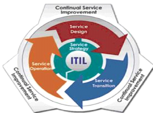
Рисунок 2. Управление процессами ITIL

Текущая версия ITIL V3 уделяет больше внимания обслуживанию и управлению, в отличие от предыдущей версии. Текущее видение ориентировано на ИТ-услуги и предоставляет концептуальные эталонные модели (как должны выглядеть процессы управления ИТ-услугами) и рекомендации по управлению услугами и процессами. Базовые публикации ITIL не содержат конкретных рекомендаций и методологий развертывания. Это предмет экспертных консультаций и других связанных публикаций. Основные публикации ITIL V3: Стратегия обслуживания ITIL; Дизайн услуг ITIL; Переход на услуги ITIL; Работа службы ITIL; Постоянное улучшение обслуживания; ITIL.