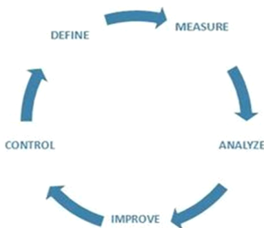
Рисунок 1. Цикл DMAIC

Фазы цикла улучшения: D (Define) – определены цели, описаны предмет и цели улучшения (продукта, услуги, процесас, данных и т. д.); M (Measure) - измерение начальных условий по принципу «что не измеряю, то не контролирую»; A (Analyze) - анализ фактов, причин недостатков; I (Улучшение) - ключевая фаза всего цикла, в которой улучшение основано на проанализированных и измеренных фактах; C (Контроль) - следует ввести улучшенный дефицит - для управления и поддержания улучшений в жизни.