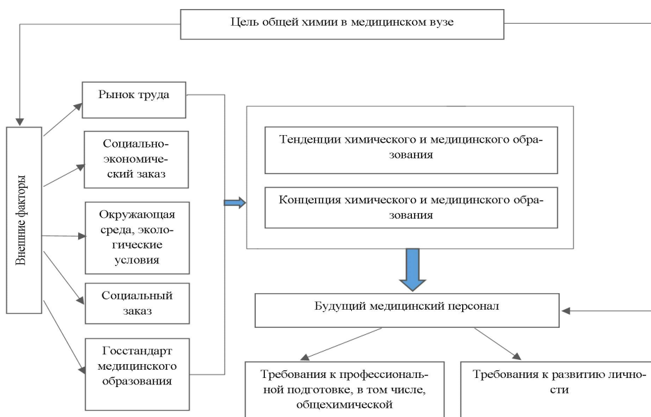
Рис.1. Модель общехимического образования в медицинском вузе

Для решения этих проблем нами создана и реализована модель целостного процесса обучения химии на этапах довузовской и начальной вузовской подготовки (рис.1). Осуществления данной работы приобрели выделенные и научно обоснованные исходные методолого-теоретические основы как ориентиры для разработки концепции, определения стратегии и методики данных преобразований. Особенности изучения курса общей химии в медицинском вузе, по нашему мнению, являются: взаимозависимость между целями химического и медицинского образования, т.е. установление межпредметной связи; универсальность и фундаментальность данного курса; особенность построения его содержания в зависимости от характера и общих целей подготовки врача и его специализации; единство изучения химических объектов на микро- и макроуровнях с раскрытием разных форм их химической организации как единой системы и проявляемых ею разных функций (химических, биологических, физиологических, биохимических и др.) в зависимости от их природы, среды и условий; зависимость методологического, эвристического, прогностического, мировоззренческого потенциала фундаментальных знаний общей химии от уровня их системности и структурной организации материи; зависимость дидактических и профессиональных ценностей от связи химических знаний и умений с реальной действительностью и практикой, в том числе медицинской, в системе